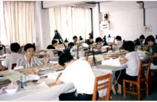
位於廣州的悠悠動畫公司（前身為時代動畫公司）工作室，攝於1990年 Staff at work in the Youyou Animation Studio (preceded by Shidai Animation Company), Guangzhou in 1990