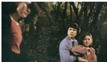
新浪潮來臨：(圖上至下)翁維銓的《行規》(1979)充滿紀實的張力，徐克的《蝶變》(1979)、許鞍華的《瘋劫》(1979)，一古一今，俱具懾人氣氛。 The dawning of New Wave: (from top) Peter Yung's The System (1979); Tsui Hark's The Butterfly Murders (1979) and Ann Hui's The Secret (1979)