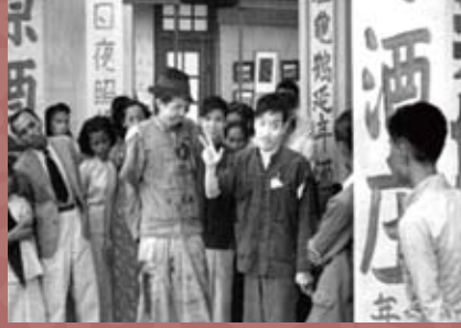
《蓬門碧玉》：馬師曾的招牌乞兒腔出場 Ma Si-tsang seizes the chance to strut his stuff with his signature Beggar Sound!