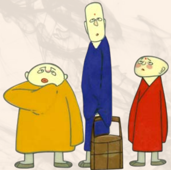
《三個和尚》 Three Monks