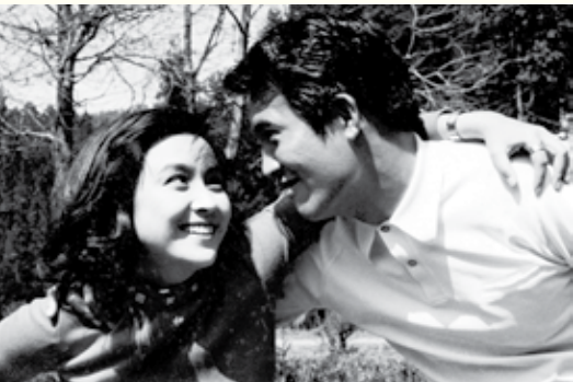
甄珍、柯俊雄紅遍港台，圖為《吾愛吾妻》(1970) Chen Chen and Ko Chun-hsiung, hotshots in both Hong Kong and Taiwan, in My Love, My Wife (1970)

七十年代初中期的香港，社會正值蛻變，婦女爭取與男性同工同酬、學生團體推行中文運動、大專學生要求認識祖國的熱潮、香港進出口貿易發達、多間證券交易所開業、發生股市狂瀉風潮等事件，可見市面大興土木之際，民心也是異常活躍。再而當我們細看這個時期的香港電影世界，會更明白電影工業以及它的天地，從來並不限於一時一地，在香港這個其時正在成形的國際都會，影業與正值文革的中國大陸幾乎隔絕，變得與台灣尤其密切。