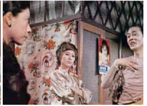
偷哢拐騙，鬼馬綽頭，極盡諷刺能事——喜劇年代來臨！圖左起：《騙術大觀》（1972）、《鬼馬雙星》（1974）和《太平山下》（1974）

Scams and shams, tricks and gimmicks, parody at its height: the age of comedy dawns! (From left) Cheating in Panorama (1972), Games Gamblers Play (1974), Fun, Hong Kong Style (1974)