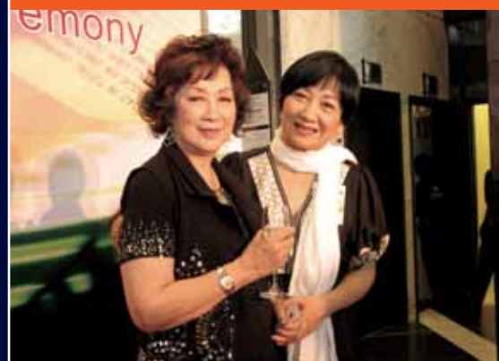
粵片紅星南紅(左)與金像影后鮑起靜 Cantonese film diva Nam Hung (left) and Hong Kong Film Awards Best Actress Nina Paw Hee-ching