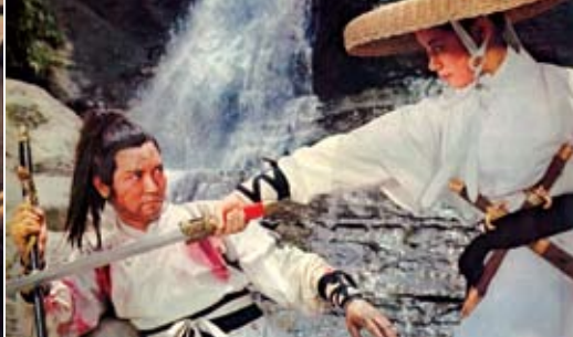
以拍武俠片稱著的郭南宏作品《五鬼奪魂》(左)及《獨霸天下》(江南、燕南希主演) The Five Devil Ghosts (left) and The Matchless Conqueror by Joseph Kuo, a celebrated martial arts film director

(1967/台)，胡金銓的《龍門客棧》、《俠女》(1971)，宋存壽的《破曉時分》(1968)、《母親三十歲》(1973/台)，李翰祥的《冬暖》(1969)，張曾澤的《路客與刀客》(1970)，還有白景瑞、侯孝賢、陳坤厚、吳念真、張毅、王童、楊德昌、蔡明亮、李安、林正盛等共十多人的作品入選。其中李行、胡金銓、宋存壽、張曾澤等，都是遊走台港兩地的影人。