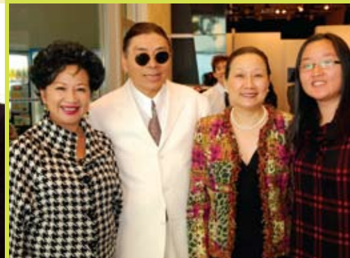
龍剛伉儷與薛家燕及其女兒 Mr and Mrs Lung Kong with Nancy Sit Kar-yin and her daughter