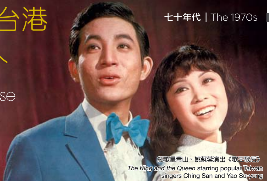
紅歌星青山、姚蘇蓉演出《歌王歌后》 The King and the Queen starring popular Taiwan singers Ching San and Yao Su-yung