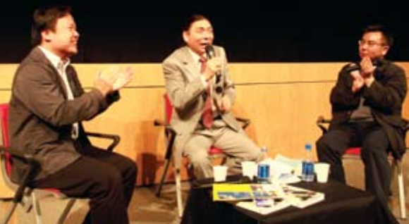
龍剛與影評人登徒 (左)、劉嶽 (右) 對談

Lung Kong in a candid exchange with film critics Thomas Shin (left) and Lau Yam (right)