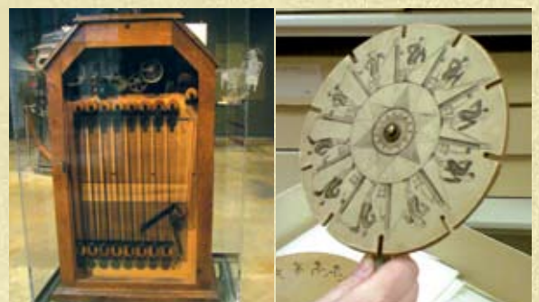
愛迪生電影視鏡（左）及Theoscope飛輪（右） The Kinetoscope (left) and the Theoscope (right)