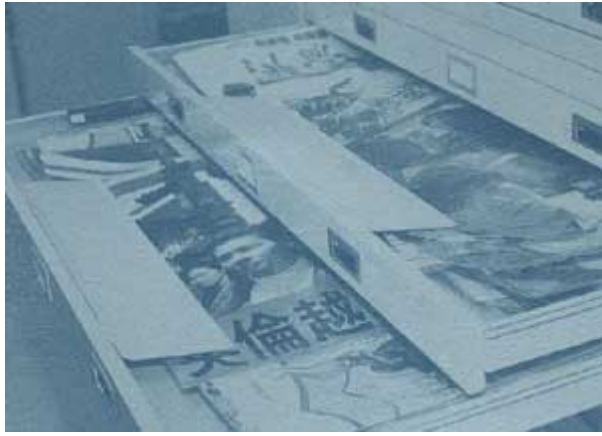
專為收藏海報而設計的鋼櫃