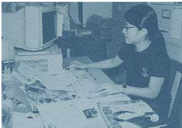
要將館藏各種形式的電影資料儲存，豈能缺少電腦資料輸入？