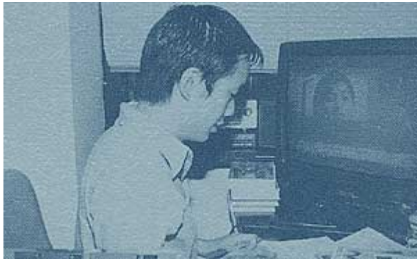
編目者絕不可鬆懈的一步 —— 品質檢定